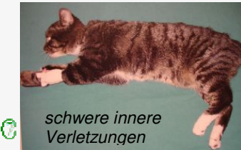
schwere innere Verletzungen

Diese "Aktion" hat diese Katze übrigens nicht überlebt ... 🙄