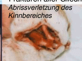
Abrissverletzung des Kinnbereiches

Katzen sind wohl Flugkünstler; wenn sie jedoch überrascht werden, aus eher geringeren Höhen fallen (aktuell haben wir im Luna-Forum einen Fall, bei dem sogar der Sturz von einem Kratzbaum bereits zu einer schweren Hüftverletzung führte!) oder ungünstig am Boden auftreffen, sind folgenschwere, oftmals sogar tödliche Verletzungen keine Seltenheit. Typische Sturzfolgen sind schwere äußere und innere Verletzungen: Weichteilschäden, Gaumenrisse, Zusammenhangstrennungen im Kinnbereich, Lungen-, Milz- und Blasenrisse, schlimmste Frakturen aller Gliedmaßen, der Wirbelsäule und des Kiefers, Becken- u. Oberschenkelhalsbrüche, Querschnittslähmung inklusive Inkontinenz. 🙄