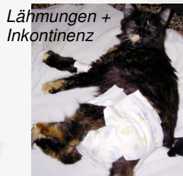
Lähmungen + Inkontinenz

dahin gesunde) Katzen haben plötzlich durch unsere eigene Schuld und Nachlässigkeit!!! große Schmerzen und nachfolgend teils schwerste Behinderungen zu erdulden. Wird das Rückenmark geschädigt, bedeutet das Querschnittslähmung, verbunden mit Inkontinenz und Kotabsatzproblemen. Ihre "Besitzer" stehen von jetzt auf gleich vor dem Problem, sehr teure Operationen bezahlen und ein schwer pflegebedürftiges Tier versorgen zu müssen. Dieses total sinnlose Leid wäre soooo leicht zu verhindern gewesen: